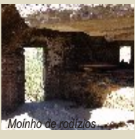
Moinho de rodízios