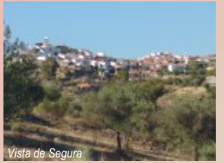
Vista de Segura