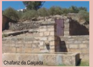
Chafariz da Calçada