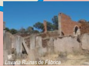
Lavaria Ruínas de Fábrica