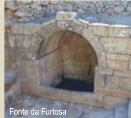
Fonte da Furtosa