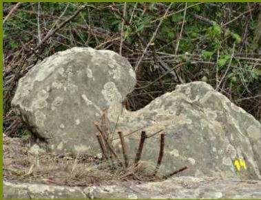
Cabeço de amarração

paredes de xisto e pequenas hortas, encontram-se devidamente assinalados um pequeno túmulo e um lagar, ambos escavados no xisto. A cerca de 200 metros deste local inicia-se o caminho secular da Barreira da