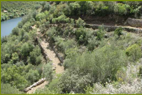
Barreira da Barca

O PR 5 “Caminho da Telhada” é um percurso circular, com cerca de 6 Km, situado na localidade de Perais, freguesia do concelho de Vila Velha de Ródão, assente numa plataforma plana, que corresponde ao terraço fluvial mais antigo do rio Tejo, formado há cerca de 1 milhão de anos.