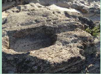
Lagar da Telhada

energias e tire partido da paisagem. Siga as orientações da sinalética e vire à esquerda subindo pelo caminho assinalado, em direcção ao Ribeiro das Ferraduras, assim conhecido pela existência de gravuras insculpidas na rocha em forma de ferradura. Este caminho, fácil de percorrer, e com