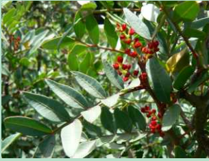
Aroeira ( Pistacia lentiscus )

Neste contexto natural vivem diferentes espécies animais como o javali ( Sus scrofa ), a geneta ( Genetta genetta ), o britango ( Neophron percnopterus ), a cegonha-preta ( Ciconia