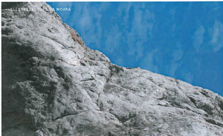
->ESCORREGADOURO DA MOURA