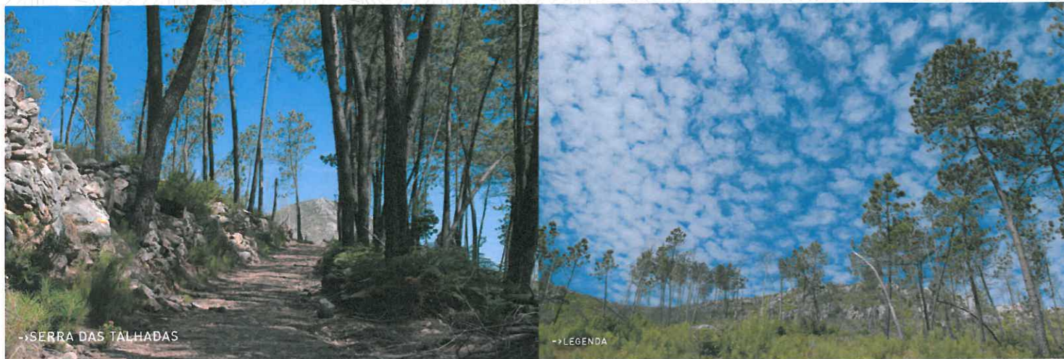
SERRA DAS TALHADAS