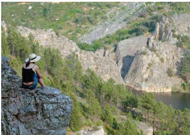
_ Miradouro nas Portas do Almourão