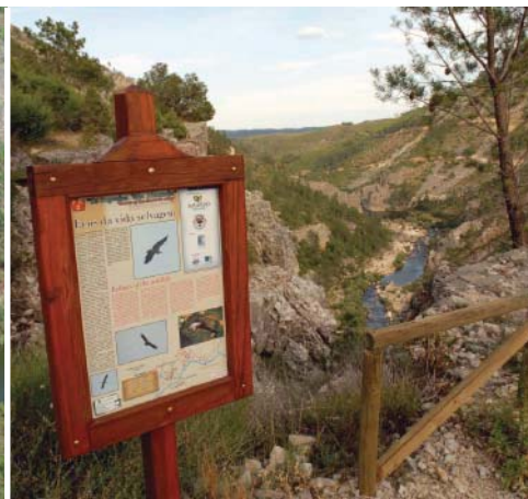
_ Miradouro no Vale do Almourão

A cerca de 1,3 Km, pare nos miradouros, onde estão disponíveis informações sobre a história e a biodiversidade deste lugar selvagem. Com três pontos de observação estratégicos, sinta a altivez das encostas escarpadas do Vale Mourão, uma garganta escavada pelo Rio Ocreza nos últimos dois milhões de anos, que parte a Serra das Talhadas em duas cristas quartzíticas. Em silêncio, pode observar os abutres, que tanto repousam nas rochas como planam no céu azul. Um pouco mais à frente, a 2,3 Km do percurso, deixe-se fascinar pela imponência das Portas do Vale Mourão.